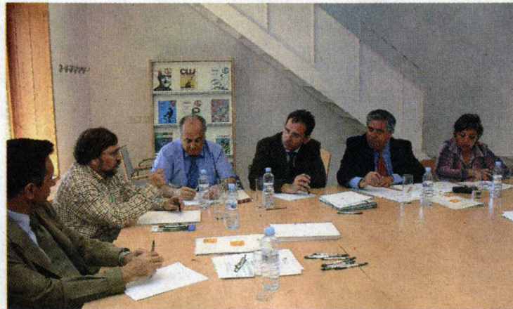
Un momento de la reunión

situación de los pequeños municipios, que por número de habitantes no han entrado en las previsiones del Proyecto y, por tanto, no reciben efectivos policiales subvencionados por la Comunidad de Madrid.